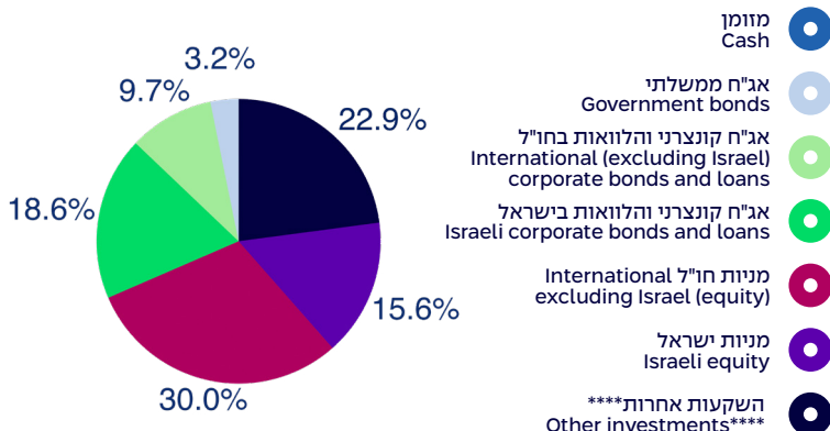
הרכב נכסים במונחי שווי ליום 31/3/2025 Composition of assets, by exposure, as of 31/3/2025

סה"כ נכסים בלתי סחירים: 34.1% Total private assets: