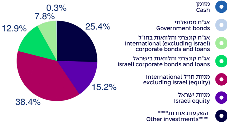
הרכב נכסים במונחי שווי ליום 31/3/2025 Composition of assets, by exposure, as of 31/3/2025

סה"כ נכסים בלתי סחירים: 36.9% Total private assets: